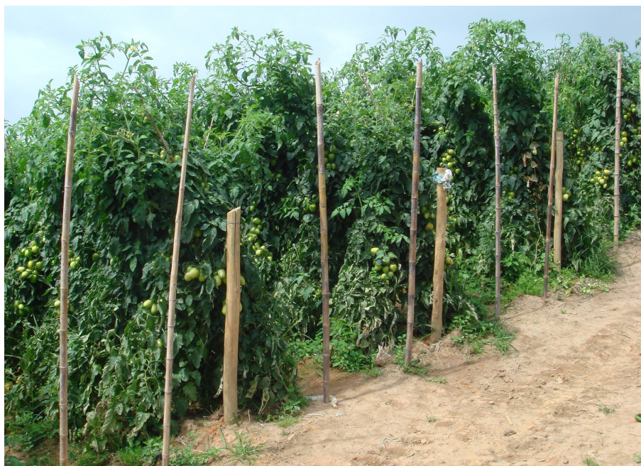
Figura 7. Plantação de tomate no sul do Estado de São Paulo em solo de textura média a arenosa, que recebeu calagem e adubação conforme a análise do solo e a exigência nutricional do híbrido utilizado. Itapetininga (SP), 2014.

A garantia de boas produtividades e qualidade comercial de tomate é obtida pela combinação da adaptabilidade do híbrido ao clima local com as boas práticas agronômicas de manejo, incluindo a calagem e a adubação. Isto é válido tanto para o tomate cultivado no campo, como sob cultivo protegido (estufa agrícola). As figuras a seguir mostram plantações de tomate que receberam um bom manejo nutricional, nas diferentes regiões produtoras do Estado de São Paulo.