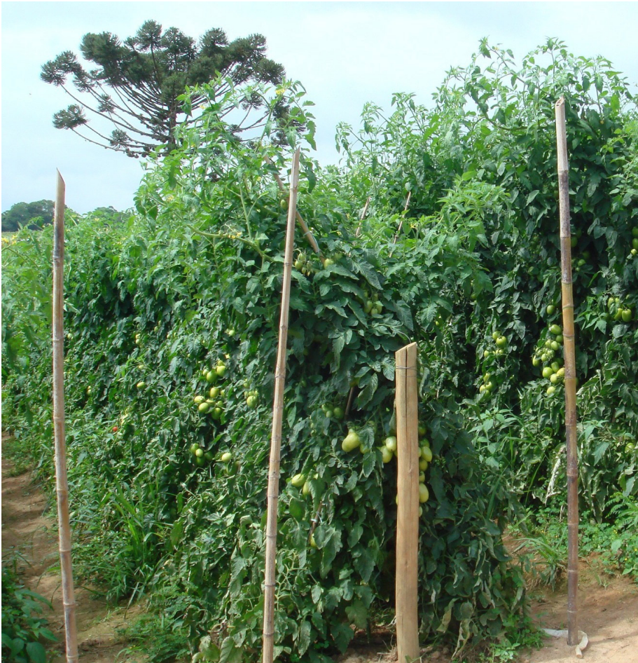
Figura 8. Lavoura de tomate típica do sul e sudoeste paulista (observar a Araucária, espécie arbórea indicativa de clima propício para obtenção de boas produções desta hortaliça). Itapetininga (SP), 2014.