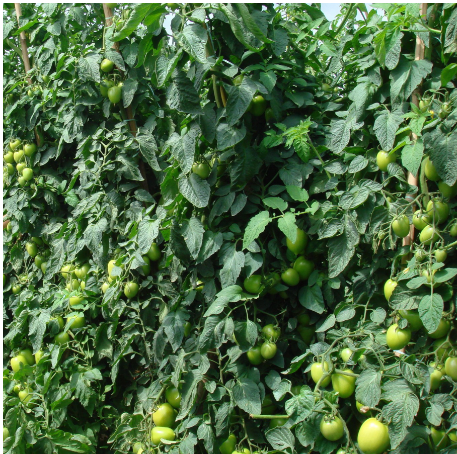
Figura 9. Plantas de tomate no campo mostrando boa uniformidade dos frutos, graças à adubações de plantio e de cobertura equilibradas. Itapetininga (SP), 2014.