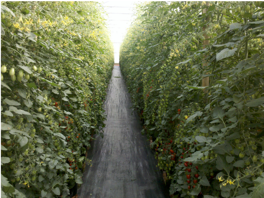
Figura 15. Tomateiro com equilíbrio vegetativo e reprodutivo, onde o monitoramento dos parâmetros da solução nutritiva foi realizado coletando-se a solução na saída do gotejo e também da solução obtida do drenado após as fertirrigações. Campinas (SP), 2015.