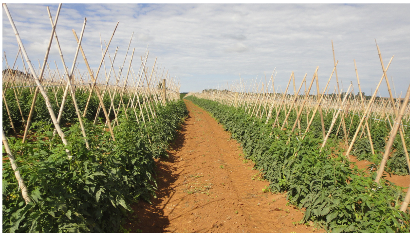
Figura 10. Campo apresentando alta uniformidade entre as plantas, principalmente quanto à altura, resultado de uma fertirrigação equilibrada (eventual deficiência de boro poderia ocasionar irregularidade nesta característica). Mogi Guaçu (SP), 2015.