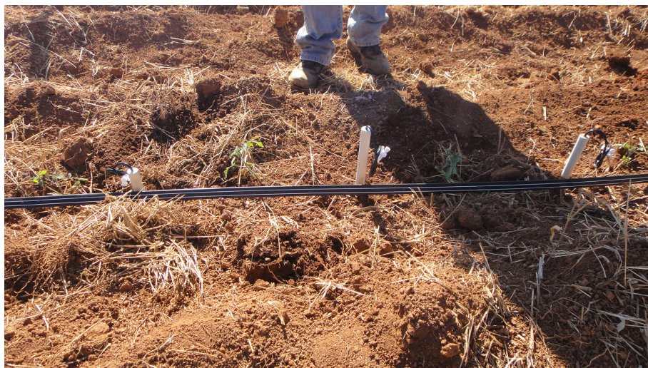
Figura 5. Cápsulas extradoras de solução do solo colocadas próximas às mudas dos tomateiros em diferentes profundidades. Campinas (SP), 2015.