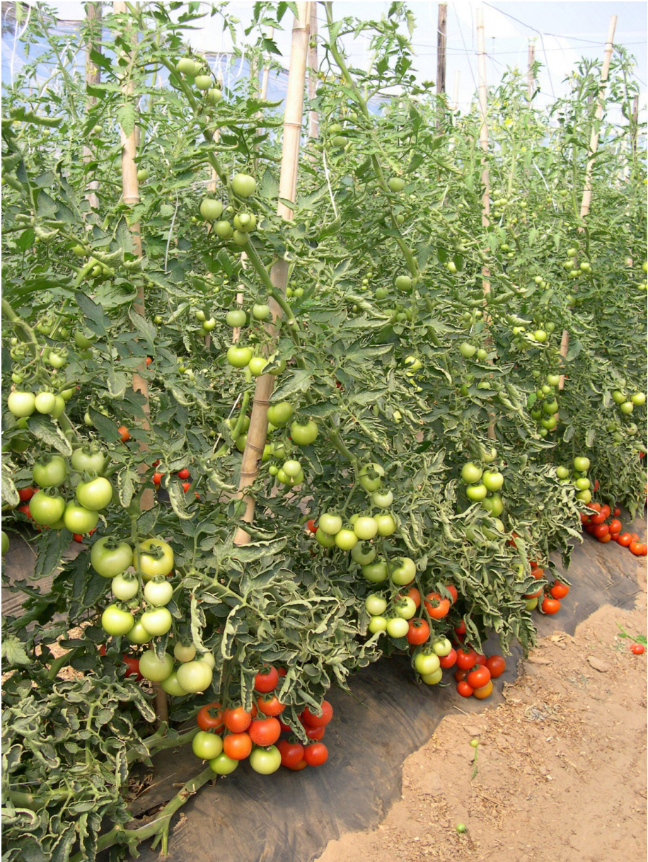
Figura 13. Plantas de tomate de penca (tipo holandês) sob cultivo protegido, com mulching de plástico sobre o solo, proporcionando boas condições de umidade. Itapetininga (SP), 2014.