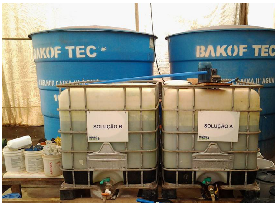
Figura 3. Tanques com soluções nutritivas A e B para posterior fertirrigação de mudas de hortaliças sob cultivo protegido. Santa Cruz do Rio Pardo (SP), 2015.