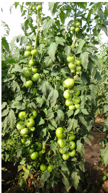
Figura 11. Tomateiro no campo expressando seu alto potencial produtivo. Nesta fase é fundamental equilibrar a nutrição para a terminação dos frutos dos primeiros cachos e a formação dos frutos dos cachos do ponteiro. Monte Mor (SP), 2015.