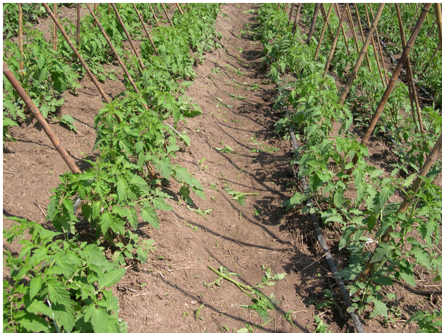
Figura 1. Plantas de tomate após a desbrota, período indicado para a adubação de cobertura, via aplicação direta sobre o solo, ou por meio da fertirrigação. Itapetininga (SP), 2014.

Nas adubações de cobertura para o tomateiro recomenda-se o cuidado para que as maiores doses de nutrientes sejam fornecidas apenas em solos de baixa fertilidade, para híbridos de alta produtividade e para locais com tomateiros conduzidos no sistema adensado de plantio. Recomenda-se reduzir as quantidades de nutrientes quando ocorreu o emprego de fertilizantes orgânicos anteriormente ao plantio. A figura 1 mostra plantas de tomate após a desbrota, ocasião da primeira cobertura com fertilizantes.