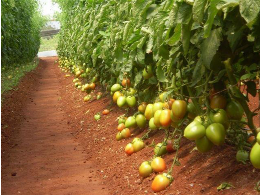
Figura 12. Plantas de tomate do tipo italiano, sob cultivo protegido (observar o adequado volume de solo junto às plantas, proporcionando o pleno desenvolvimento das raízes). Santa Cruz do Rio Pardo (SP), 2012.