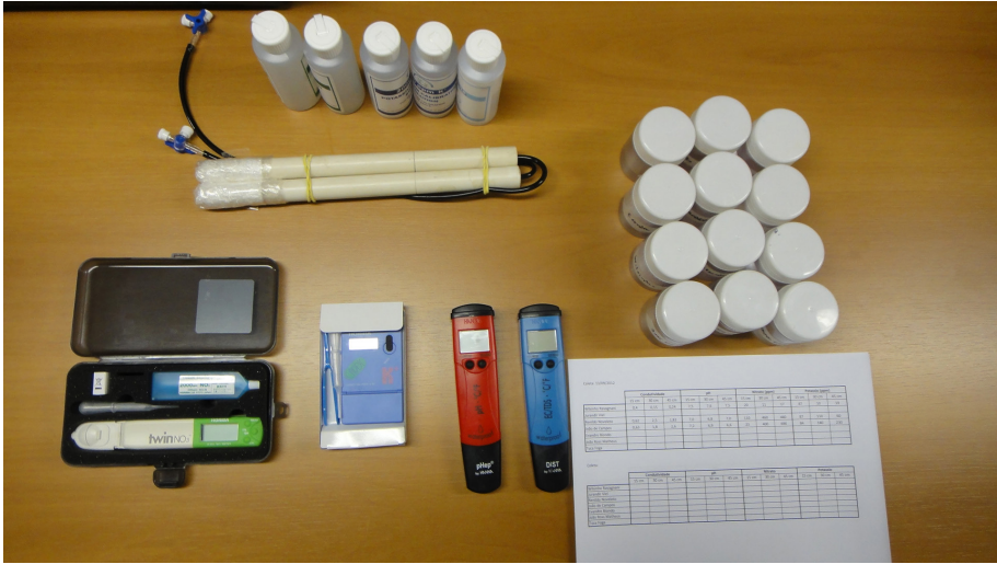
Figura 4. Abaixo, da esquerda para direita: medidor de íons para nitrato, medidor de íons para potássio, pHmetro, condutivímetro e planilha para anotação das medições, por data e profundidade do extrator. Acima à esquerda: extratores de solução e soluções para calibração dos equipamentos. Acima à direita: potes identificados para coleta da solução a campo. Campinas (SP), 2015.

Os extratores, onde anteriormente foi realizado o vácuo, são colocados dentro de um balde com água para umedecer a cápsula porosa. A instalação destes deve ser realizada com cuidado, para se obter o máximo de contato entre a cápsula e o solo. Para isso, após perfurar na profundidade desejada, colocar água antes de instalar o extrator. A primeira extração deve ser descartada.