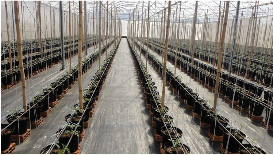
Figura 14. Sistema de plantio em vasos com linhas duplas de gotejamento para melhor distribuição de água e nutrientes (observar a uniformidade dos tomateiros na primeira semana após transplante). Campinas (SP), 2015.